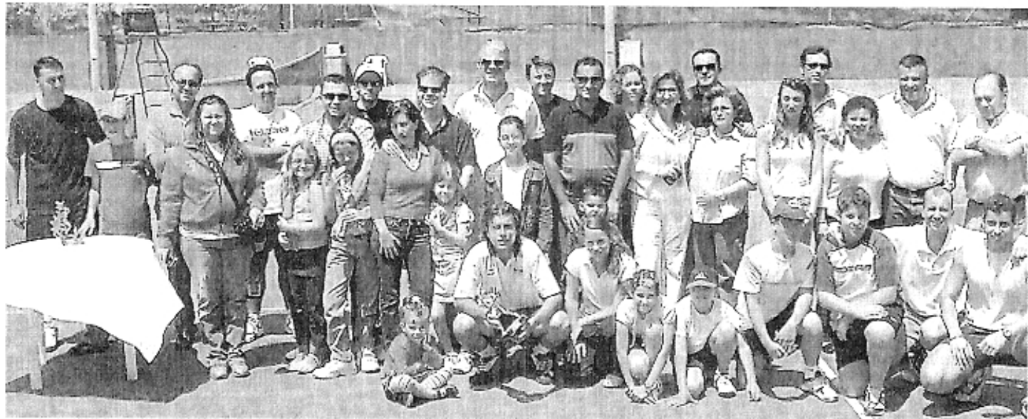
Algunos de los participantes más destacados, acompañados por sus familiares, durante la entrega de trofeos celebrada en la cancha principal del Club Tamarasit. | I. I. S.